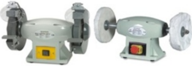
ZİMPARA VE POLİSAJ MOTORLARI 125mm DEN 250mm ARASI ÖLÇÜLERDE