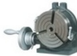
YATAY İNDEKS & AYNALI YATAY DİKEY İNDEKS