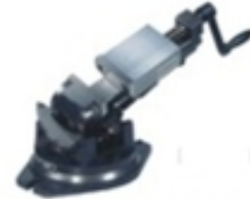
ÜÇ EKSENLİ MENGENE