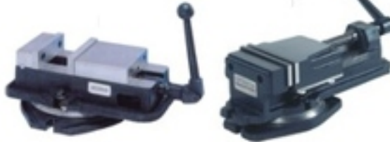
MAKİNA MENGENELERİ 100mm - 200mm ÖLÇÜLER